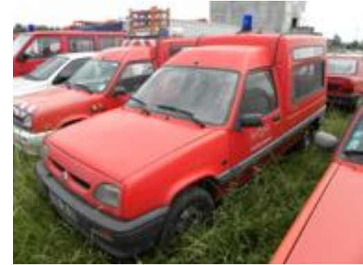
Lot N°20 – VFI805