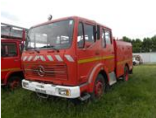
Lot N°5 - FPT 243