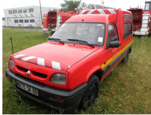
Lot N°18 – VFI 750