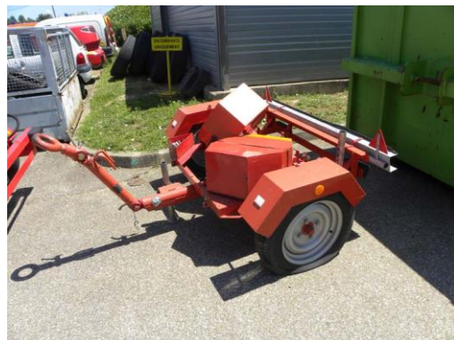
Lot N°30 – RPO 3279