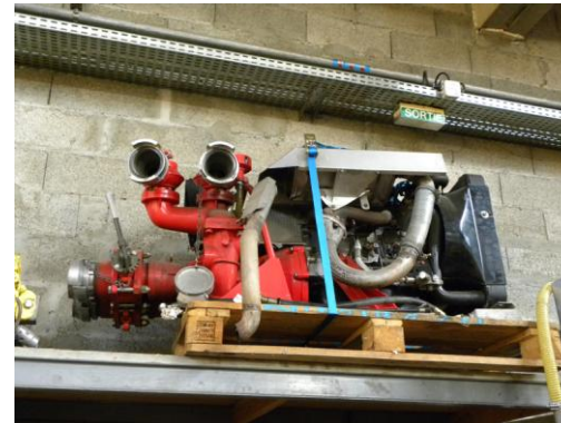
Lot N°42 – MP