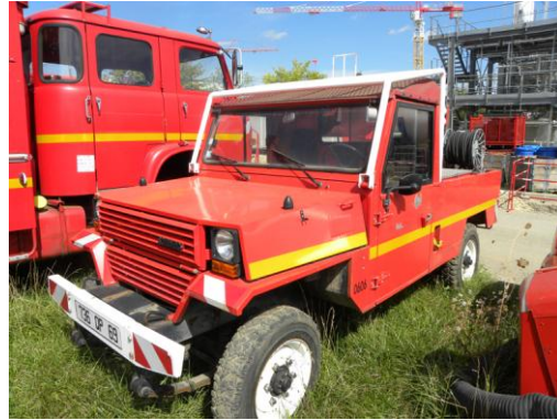
Lot N°10 – CCFL 606