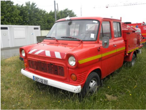
Lot N°1 - VPI 99