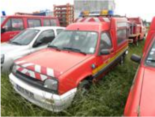
Lot N°17 - VLPC 704