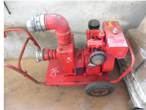
Lot N°38 – MPE30 3046