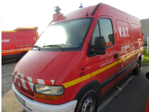
Lot N°25 - VAT 1177