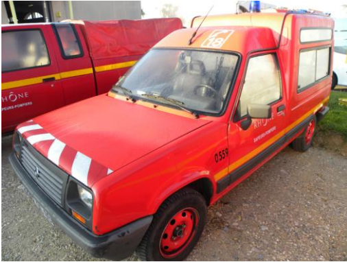
Lot N°9 - VLI 559