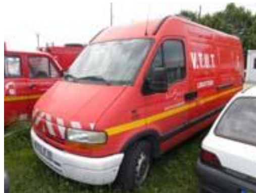
Lot N°26 – VTUT 1179