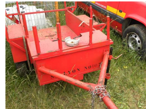
Lot N°28 – MPREP 3107