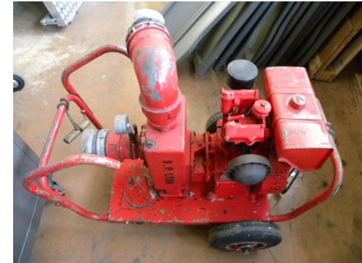
Lot N°39 – MPE30 3049