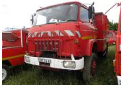
Lot N°2 - CDHR 117