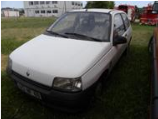
Lot N°13 - VFB 664