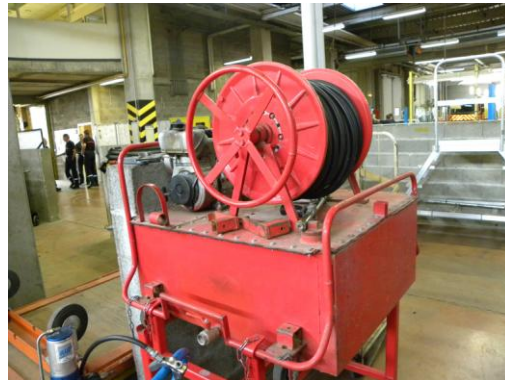
Lot N°42 – GHP