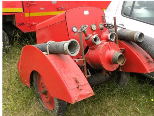
Lot N°37 – MPR45