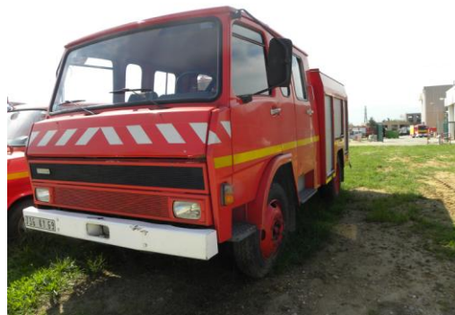
Lot N°6 - FPT 282