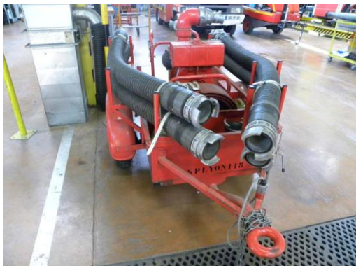
Lot N°29 - MPREP 3118