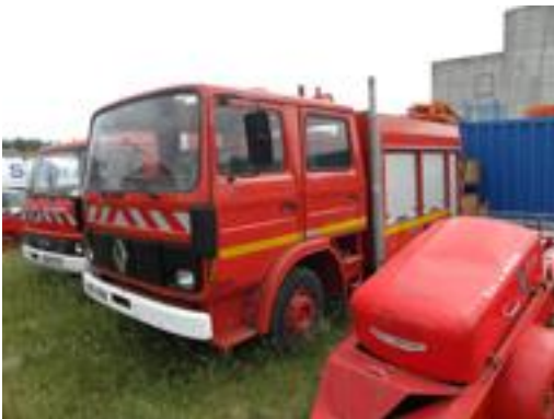
Lot N°21 - FPTL 813