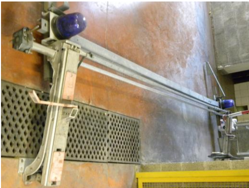
Lot N°40 - 1 Pporte echelle simple