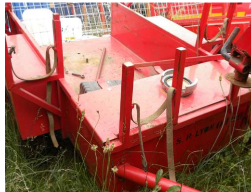
Lot N°27 – MPREP 3106