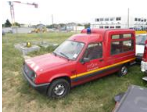
Lot N°22 – VFI 857