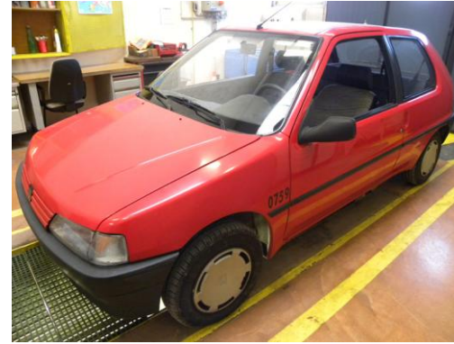
Lot N°19 – VLI 759