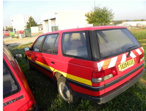
Lot N°15 – VLI 686