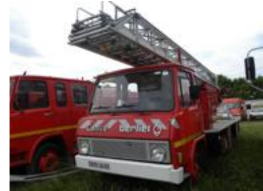
Lot N°4 - EPS24 197