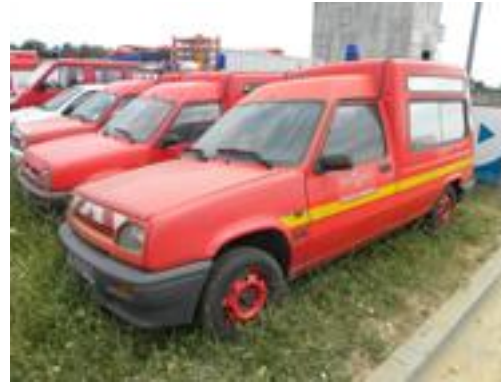
Lot N°11 – VFI 646