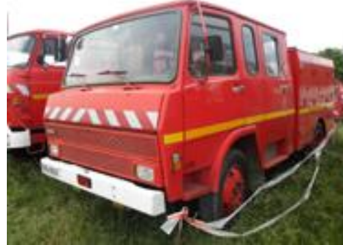
Lot N°3 - FPT 170