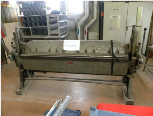
Lot N°36 - Presse plieuse