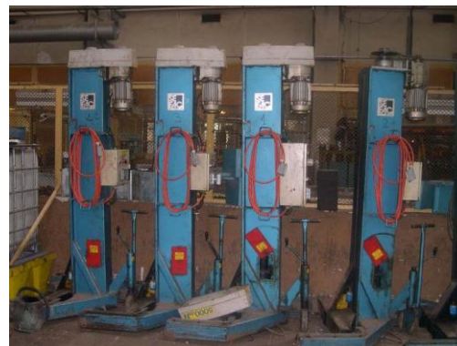
Lot N°34 – Colonne élévatrice 5586