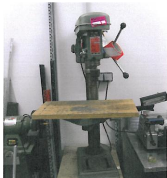
PERCEUSE A COLONNE