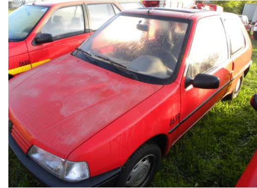
Lot N°12 – VLI 659