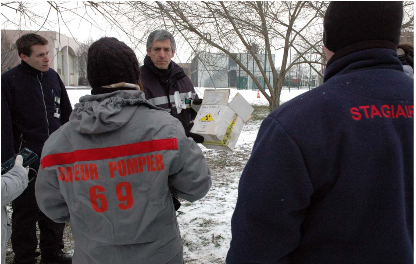
Debriefing après la « manœuvre irradiation avec prise en charge d'une victime », thème du 3ème atelier.